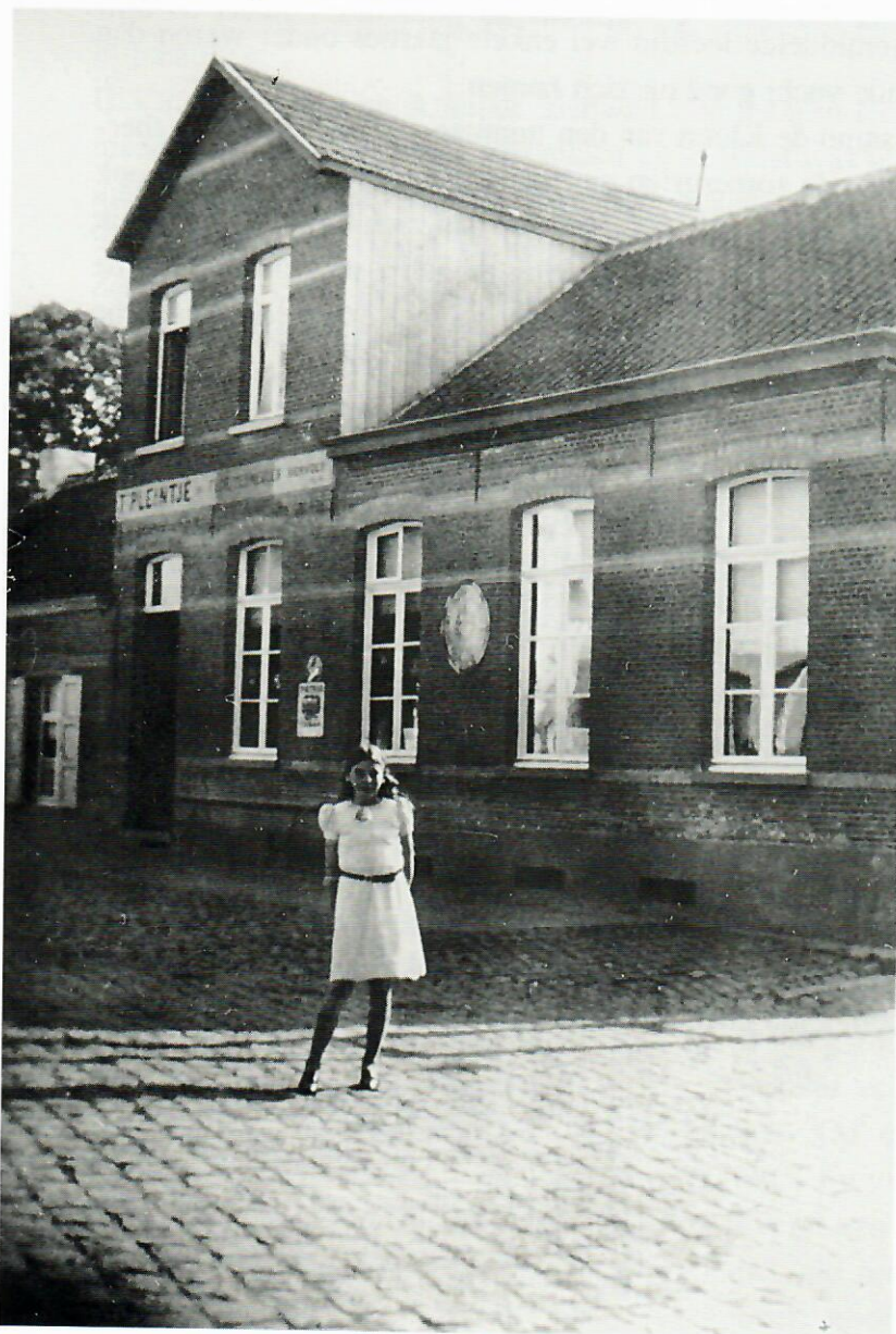
Madeleintje voor het vroeger Pleintje.

Eén Duits of twee Duitsers dat is nog wel te verdragen en als 't echt niet anders kan een heel autobus vol, maar 't is een ander paar mouwen als ze allemaal tegelijk komen. Op 10 mei 1940 vonden onze oosterburen het nodig "für das Vaterland" ons landje nog maar eens onder de voet te lopen. De gruwelen van 1914-'18 indachtig was eenieder van de grootste vrees vervuld. Hoe zou "den wreeden Duitsch" deze keer weer tekeer gaan? In '39, ten tijde van de mobilisatie, had het Pleintje al heel wat Belgische soldaten over de vloer gehad. Het was een vreemde, verwarrende periode met onzekerheid en angst voor hetgeen komen zou. Het Pleintje bleef open, ook toen op